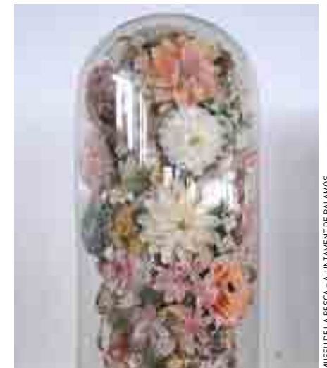
MUSEU DE LA PESCA - AJUNTAMENT DE PALAMOS