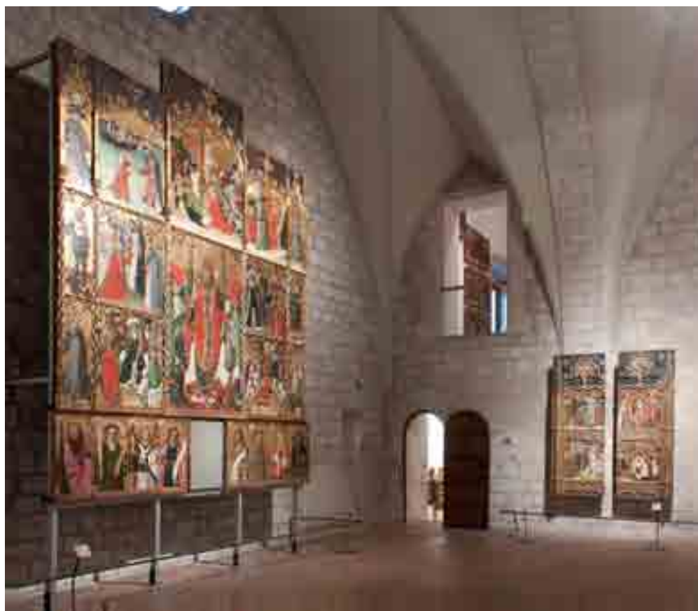
MUSEU D'ART DE GIRONA - ADI - RAFAEL BOSCH