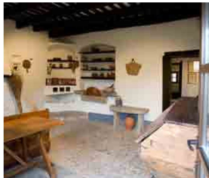
JORDI VILA - ARXIU FV