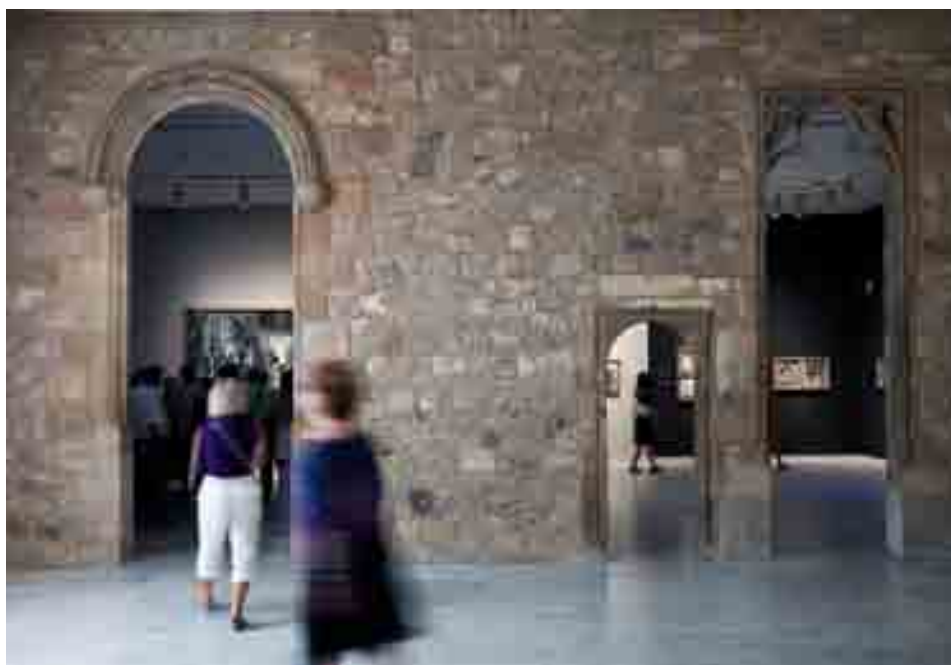
MUSEU PICASSO, BARCELONA.