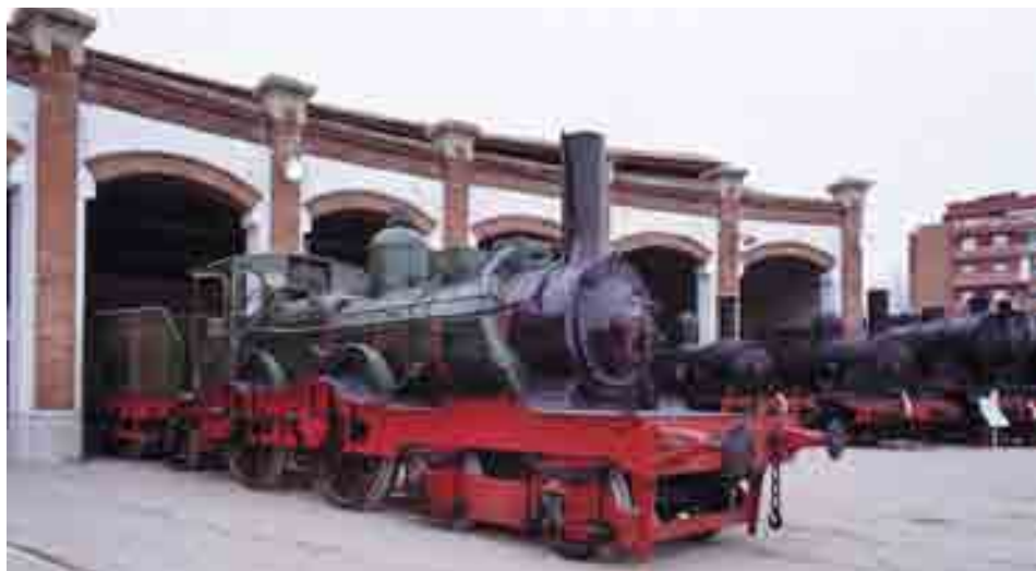
MUSEU DEL FERROCARRIL