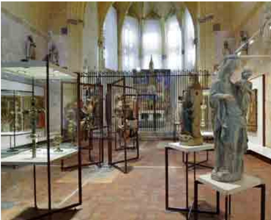
MUSEU DIOCESÀ - R. CORNADO