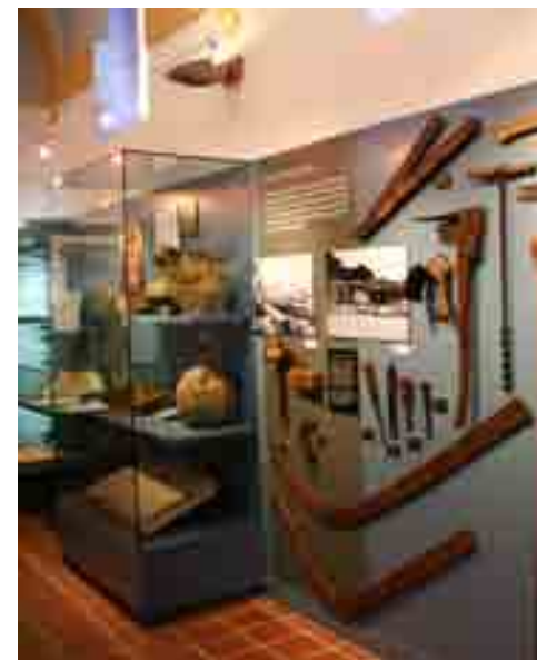
MUSEU D'ARENYS DE MAR

museu d'arenys de mar , arenys de mar, maresme