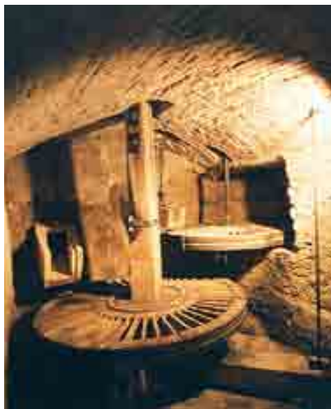
MUSEU DE CAMBRILS

museu d'història de cambrils , cambrils , baix camp