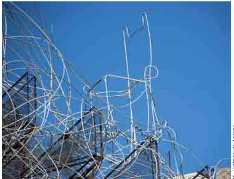
GALA / © FUNDACIÓ ANTONI TÀPIES, 2013