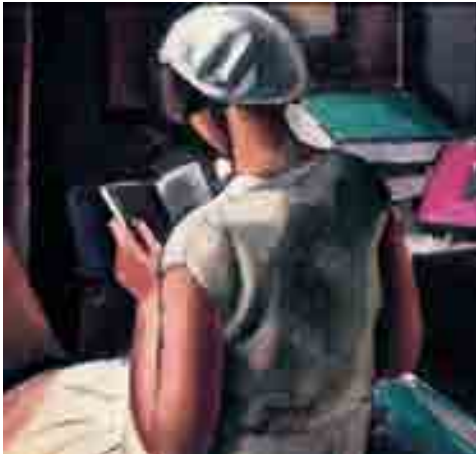
MUSEU D'ART DE SABADELL

museu d'art de Sabadell, Sabadell , Vallès Occidental