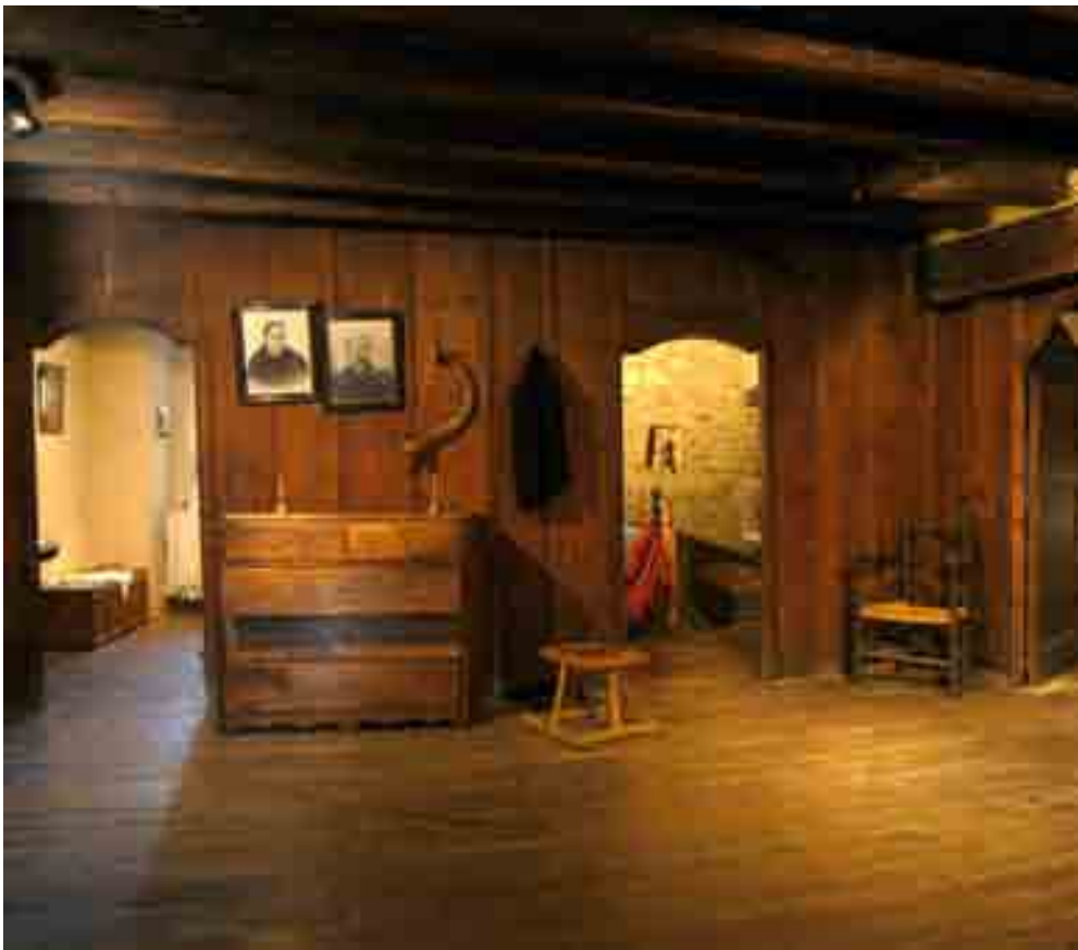
ECOMUSEU DE LES VALLS D'ÀNEU