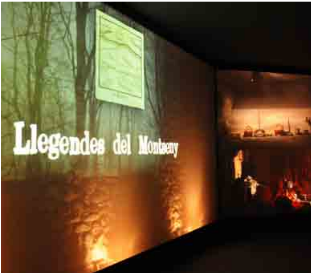
MUSEU ETNOLÒGIC DEL MONTSENY