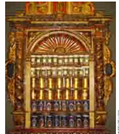
MUSEU DE LLÍVIA