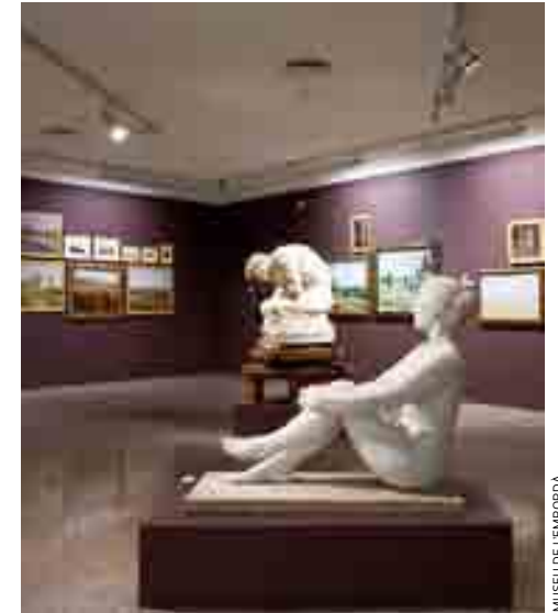
MUSEU DE L'EMPORDÀ

museu de L'empordà, Figueres , al t empordà