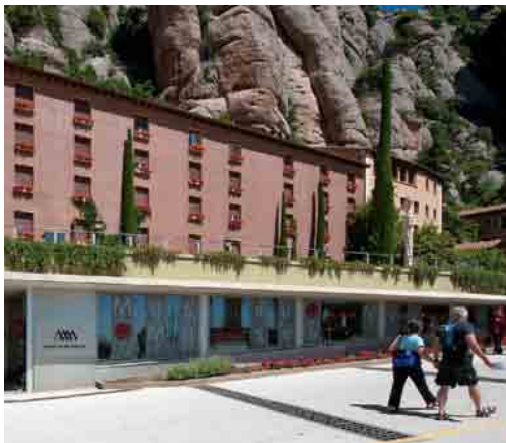
MUSEU DE MONTSERRAT