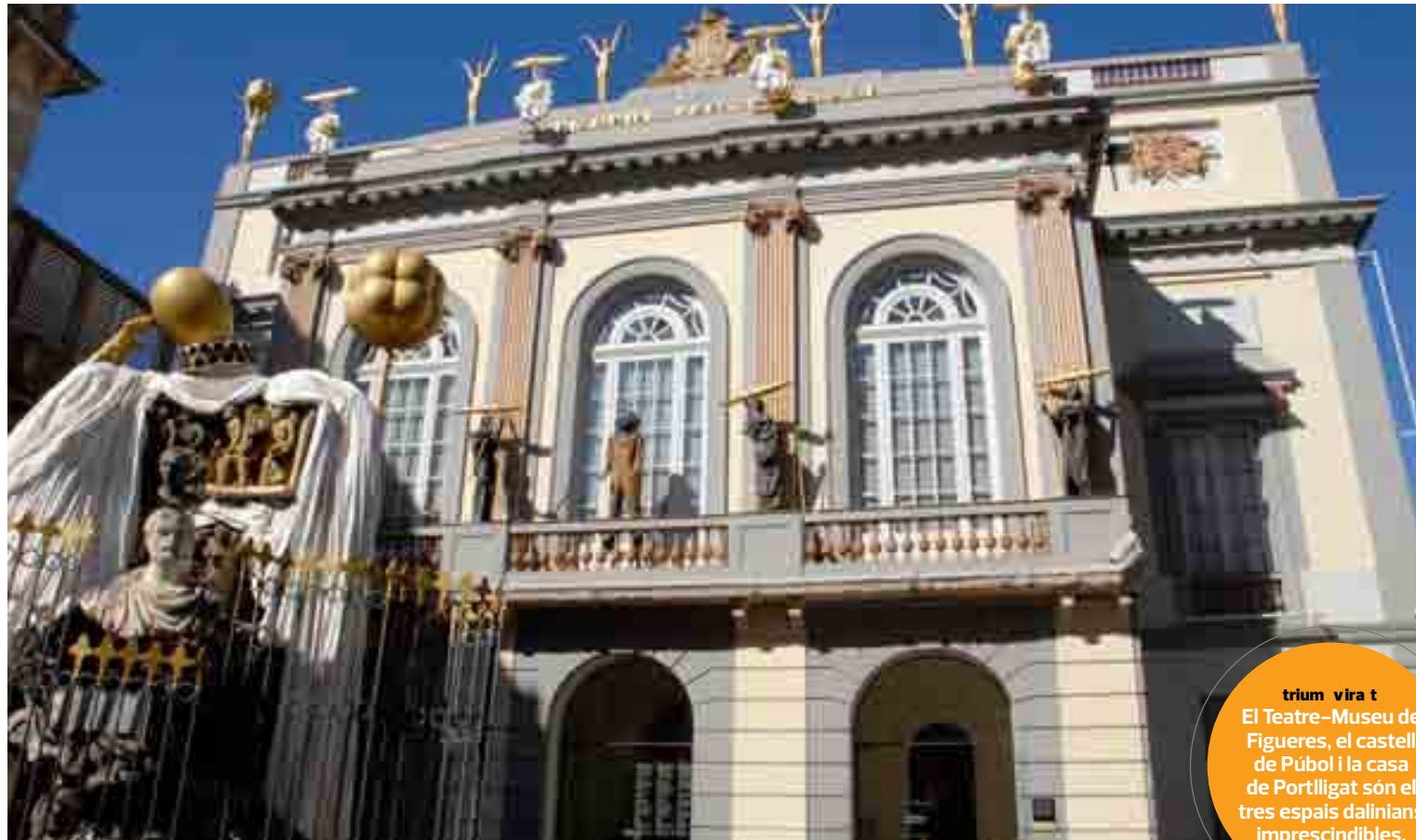
FUNDACIÓ GALA - SALVADOR DALÍ

triumf vira t El Teatre-Museu de Figueres, el castell de Púbol i la casa de Portlligat són els tres espais daliniàns imprescindibles.