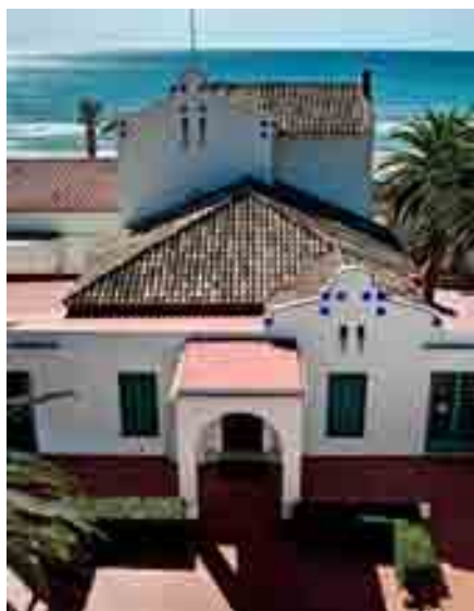
VILA CASALS - LINUS URPI